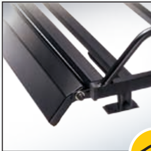
Nog minder windruis met onze spoiler. (optie)

Met een opsteekrol, aan de achterkant, kunt u ergonomisch verantwoord laden en lossen. Ook kunt u een spoiler aan de onderkant van de voorzijde monteren, dit reduceert het windgeruis. En niet te vergeten, een ladder op de rechter achterdeur van 180 graden draaiend (niet op de achterklep) is wel zo veilig, zeker met de antislip treden. Wel zo handig!