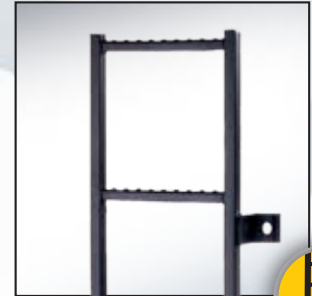
Deurladder. Eenvoudig laden en lossen. (optie)