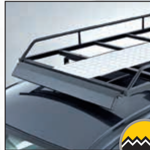
Aluminium loopbaan. (optie)